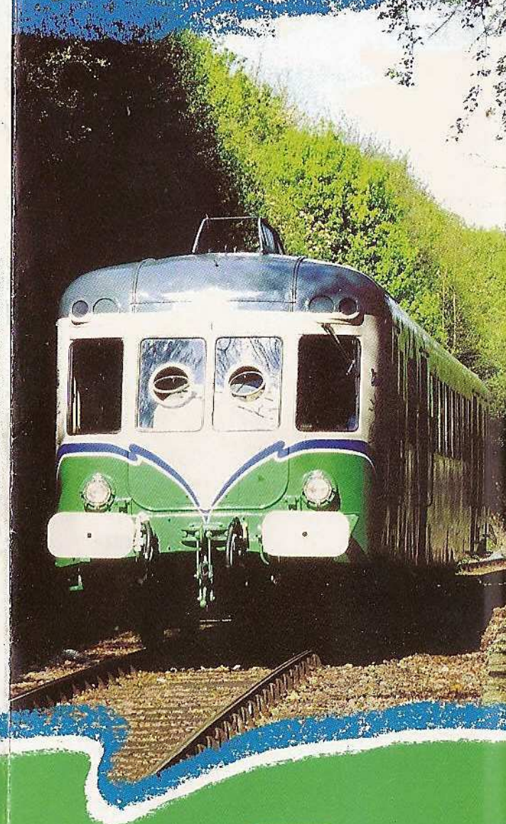
Illustration communication La Vallée du Loir - Le Mans